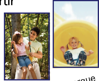
Vaya con él al parque