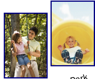
Going to the Park